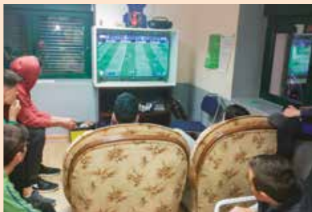
Torneo FIFA Casa de la Juventud