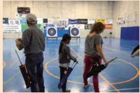
Exhibición fin de escuelas