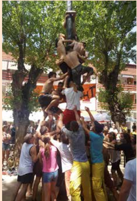
Cucania de adultos