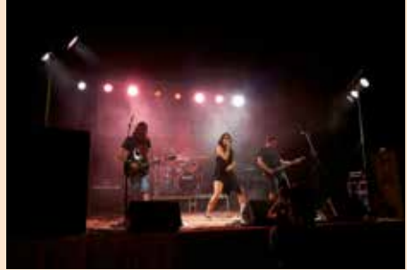
Concurso de bandas Fiestas Patronales