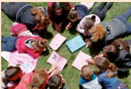
Taller en familia. Guardianes de la Naturaleza