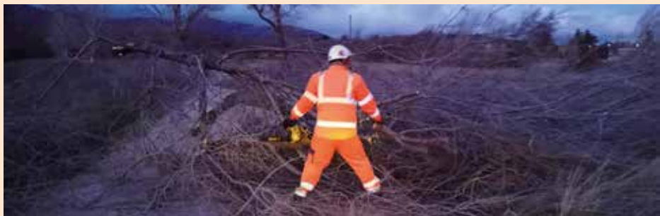
Protección cicvil colaborando tras las fuertes rachas de viento