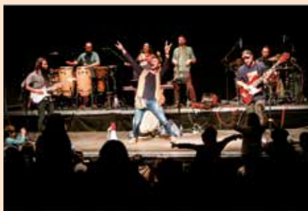
Concierto infantil Yo soy ratón