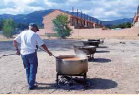
Patatada solidaria 15 de agosto