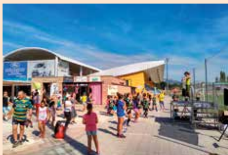
Día del deporte en familia