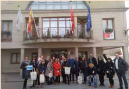
Visita profesores de Erasmus