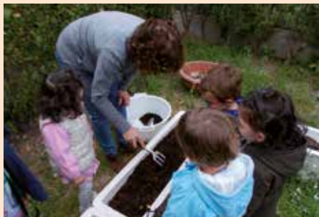
Compostaje en la Escuela Infantil