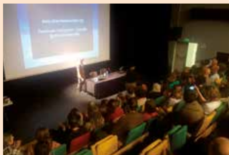
Jornadas Bicimundo 2019