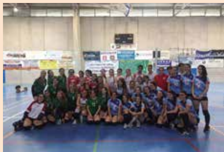
Fase Zonal Voleibol