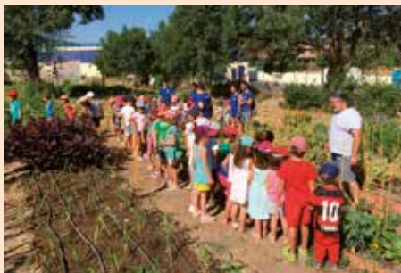
Los campamentos visitan el Huerto Comunitario Ecológico Matarrubias