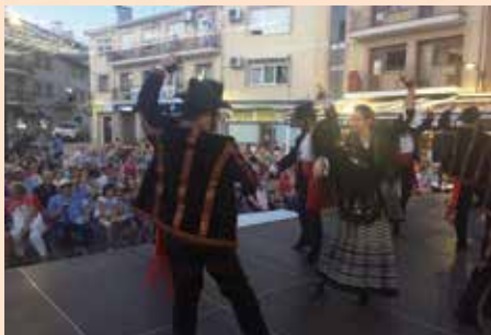
Bailes regionales el Día de los Abuelos