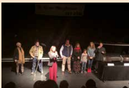
Gala presentación radio Soto