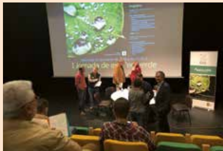
Jornada de Empleo Verde