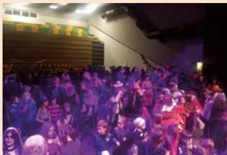
Fiesta de Halloween en el CAT