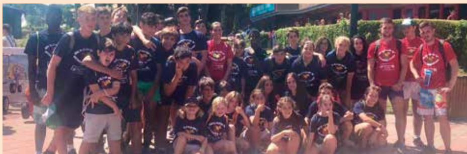
Excursión Parque de Atracciones