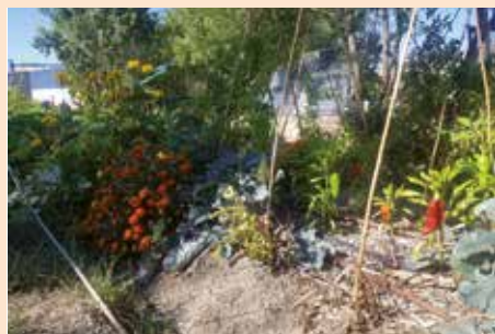
Huerto comunitario Ecológico Matarrubias