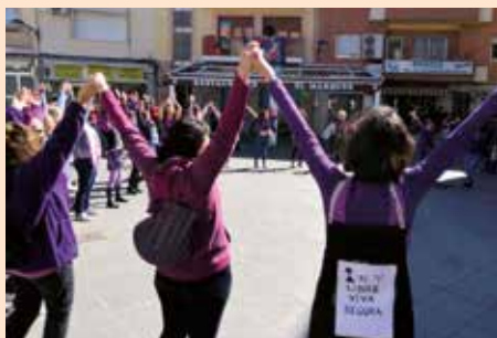
Fashmove comisión feminista