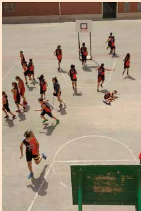
Campus de verano Soto Basket