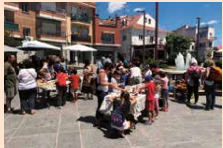
Taller de cerámica