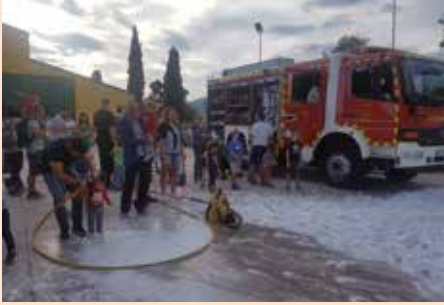
Fiesta solidaria _Bomberos Ayudan_ durante las Fiestas en Honor de la Virgen del Rosario