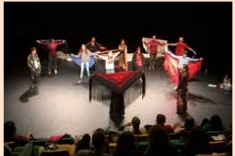
Alumnos de intercambio conocen las instalaciones municipales