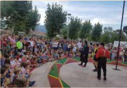
Circo de calle en la Inauguración del CAT