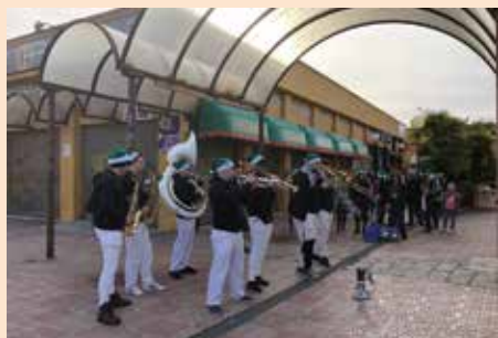
Aperitivo con charanga en Nochebuena