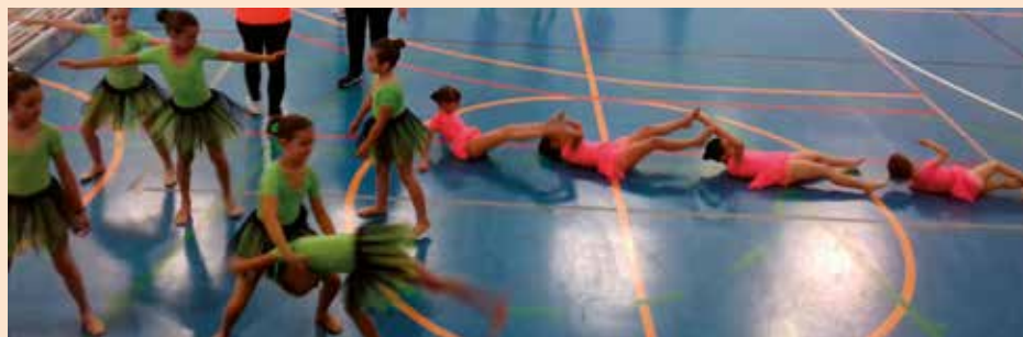
Exhibicion fin de escuelas