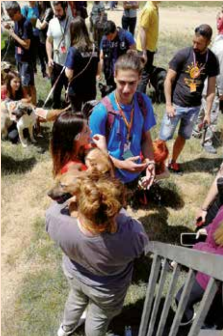
II Jornada de Adopción de Soto del Real