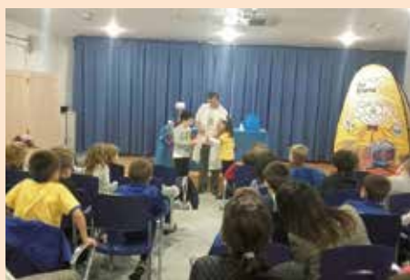
Taller divulgación científica