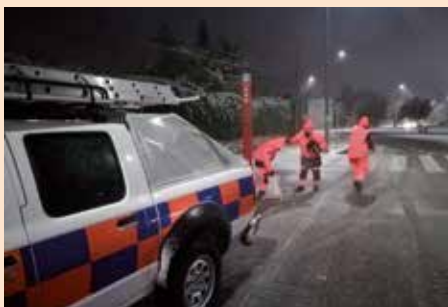
Voluntarios de Protección Civil trabajando durante las nevadas invernales