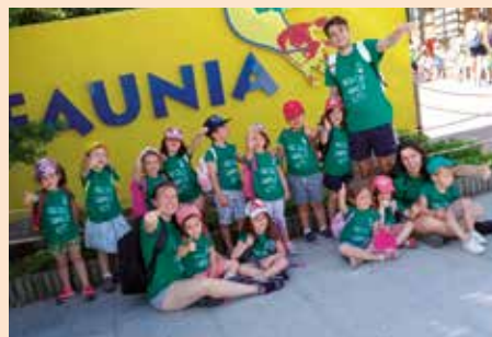
Excurisión a Faunia