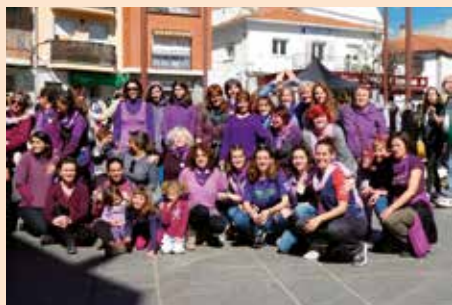
Concentración en la Plaza el 8 de Marzo