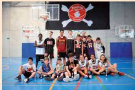
Torneo 3x3 Fiestas Patronales de baloncesto