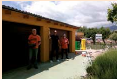
Abre el Bici-Taller social de Soto