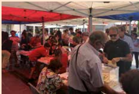
V Pregunta Ciudadana de Soto