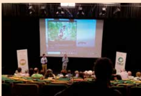
Ciclo de Cine Documental Virunga de Amigos de la Tierra y Aso. Chozas de la Sierra