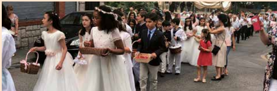
Corpus Christi Soto del Real