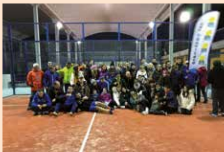
Torneo de padel navidad