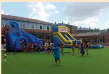
Campeonato agosto y septiembre