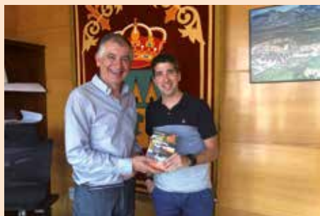
Ganador reto Muévete por Soto de mayo 2019