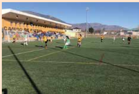
Triangular benéfico femenino