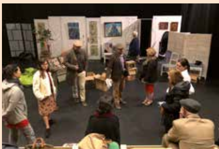
Festival de Teatro Amateur 2019