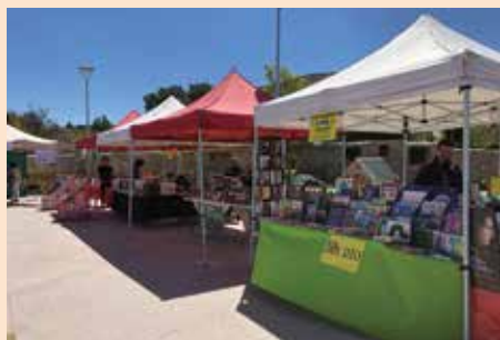
Feria del libro