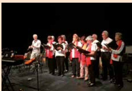
Presentación de la Escuela Municipal de Música