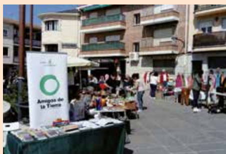
Amigos de la tierra, rastrillo