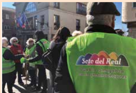
Rally fotografico pueblo amigable con las personas mayores