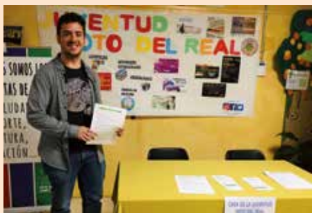
La Casa de la Juventud en las jornadas profesionales del IES