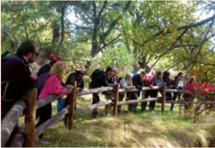
Recorrido por el Camino de Santiago Mendocino a su paso por Soto