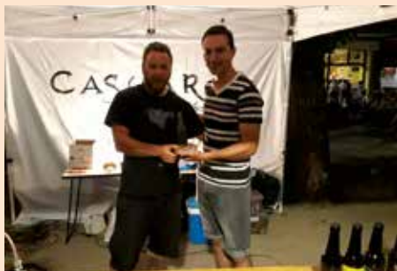
Ganador de la mejor cerveza de la Feria de Cerveza Artesana 2019