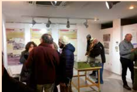
Exposición Patrimonio histórico de Soto del Real de la Asociación Chozas de la Sierra