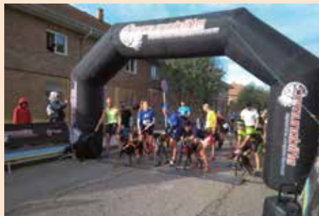
Canicross solidario de Aso. Corazón Animal