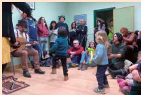
Roscón de Reyes con la Asociación Chozas de la Sierra