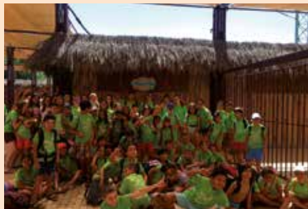
Excursión al Aquópolis con Juventud