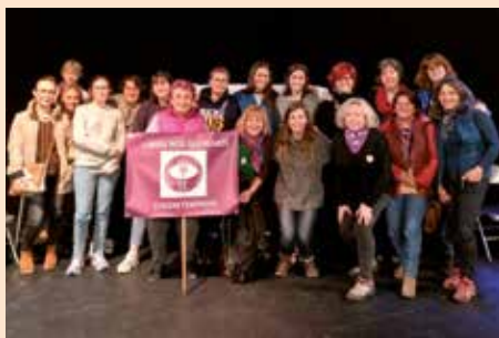
Conferencia viajar sola