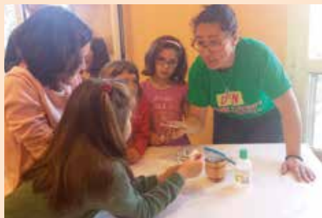
Taller en familia, Mujeres en la ciencia