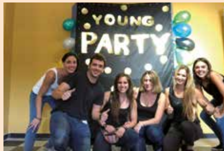
Young Party _Soto se mueve sano