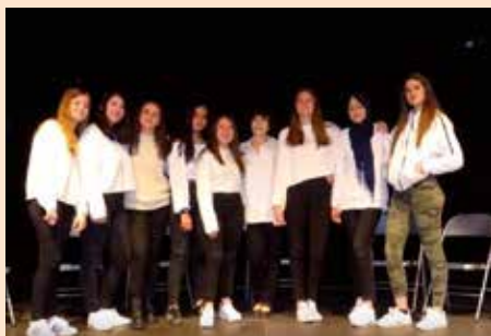
Mujeres de ciencia