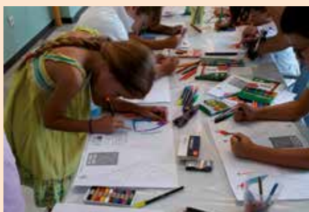
Taller cometas en la inauguración del CAT