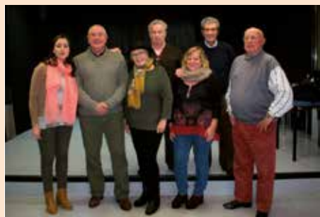
Hogar, nueva directiva