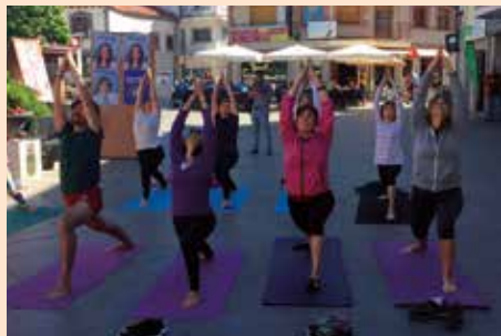
Festival de yoga