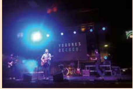
Concierto de Yogures de Coco en las Fiestas