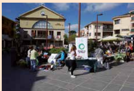
Rastrillo segunda mano