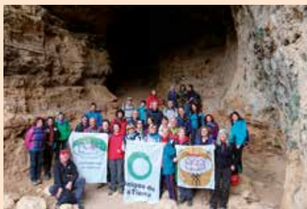
Salidas Climáticas con Amigos de la Tierra, Aso. Chozas de la Sierra y Ecos de Miraflores