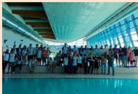
Down Swim Fest