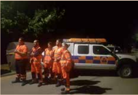
Protección Civil Soto en las Fiestas Patronales