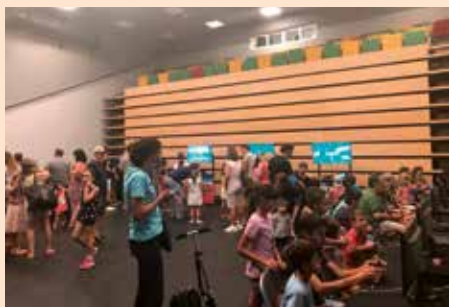
Videojuegos y realidad virtual en la Inauguración del CAT