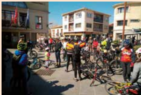
Ruta en bici con el huerto