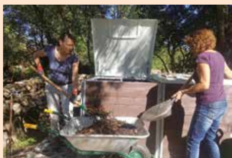
Proyecto piloto de compostaje comunitario en Urb. Sierra Real