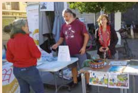
Feria de Asociaciones locales