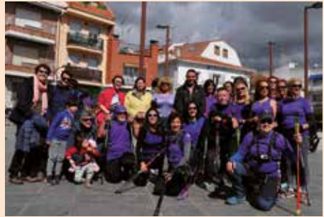
Caminata 8 de marzo la Maliciosa