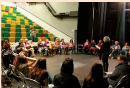
II Encuentro de mujeres