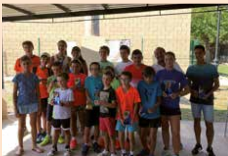
Torneo de fiestas de tenis