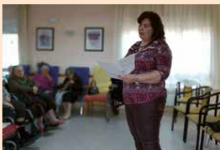
Biblioterapia para mayores