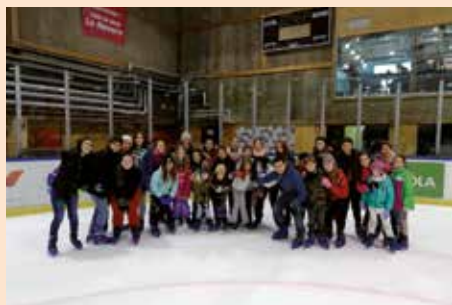
Excursión a patinar sobre hielo con juventud