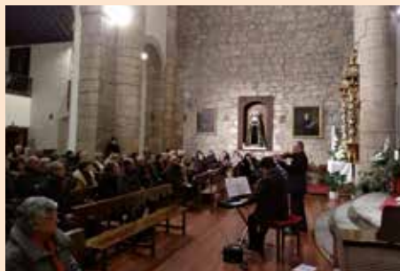
Concierto en la Iglesia