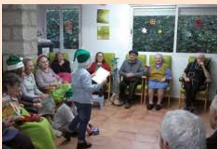
Lectura en residencias