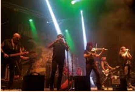
Concierto de Mago de Oz