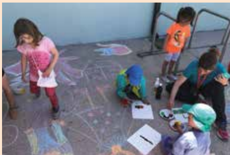
Festival del color