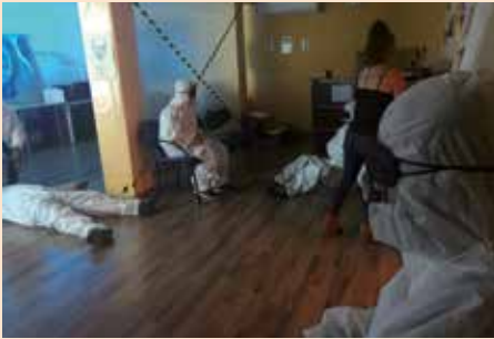
Scape room +18 casa de la juventud