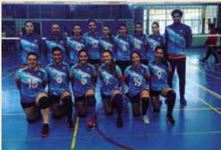
Voleibol Soto Fase zonal