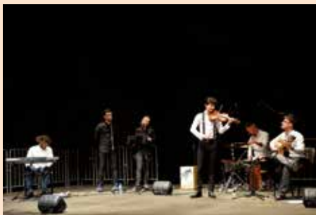
Concierto de Malevaje