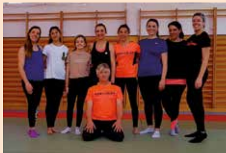
XI Taller de Defensa Personal por el Día de la Mujer