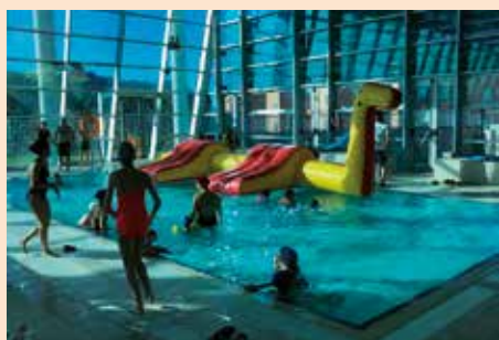
Hinchables en la Piscina Cubierta en Navidad