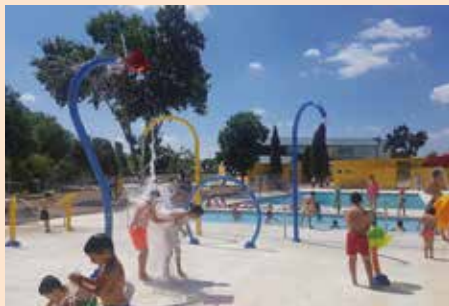
Piscina de verano