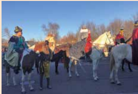
Cabalgata de Reyes