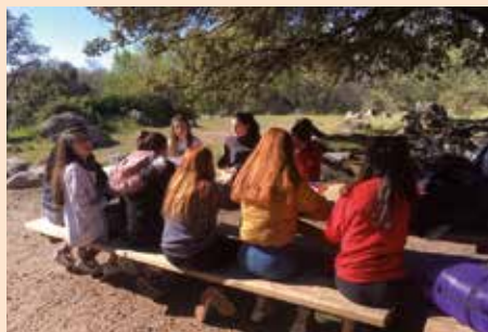
Noche joven prevención consumo drogas