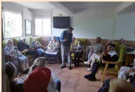
Biblioterapia para mayores