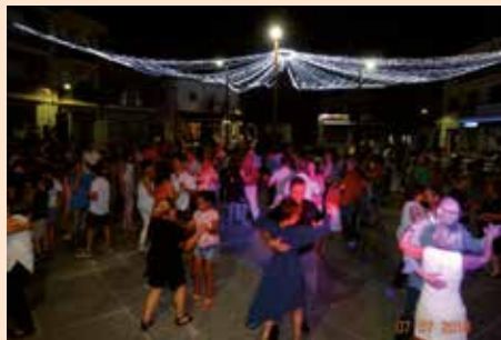
Noches de baile en la Plaza