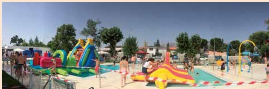
Juegos hinchables en la Piscina de Verano