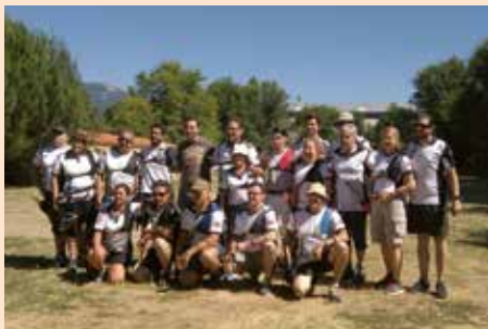
XX Trofeo Nuestra señora del Rosario