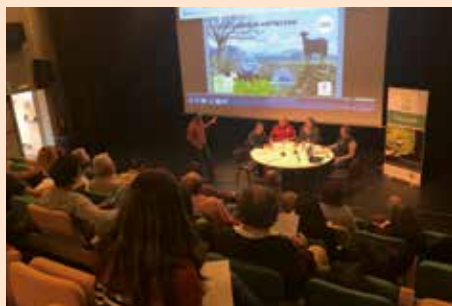
I Jornada de Empleo Verde de Soto