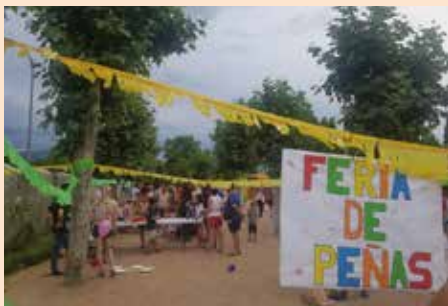
Feria de Peñas