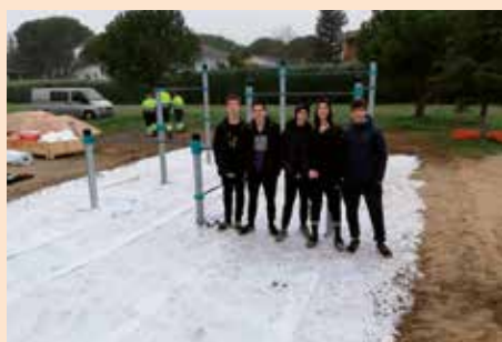
Nuevo parque de Parkour