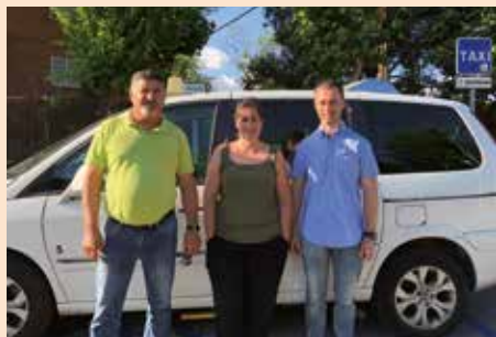
Soto + cerca cumple 1 año en julio 2018