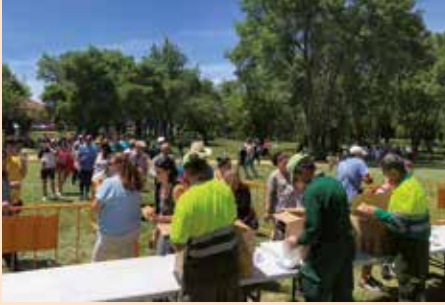
Reparto de bollos preñaos por San Isidro