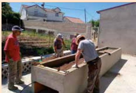
Elaboración de bancales en altura en el Huerto Comunitario para mayores o personas con movilidad reducida