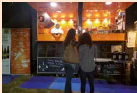
Feria de la cerveza