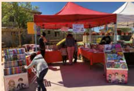
Feria del libro