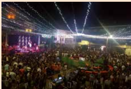
Plaza de la Villa en Fiestas Patronales