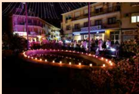
Noche en Vela