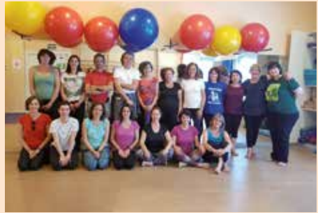
Taller el arte de la respiración