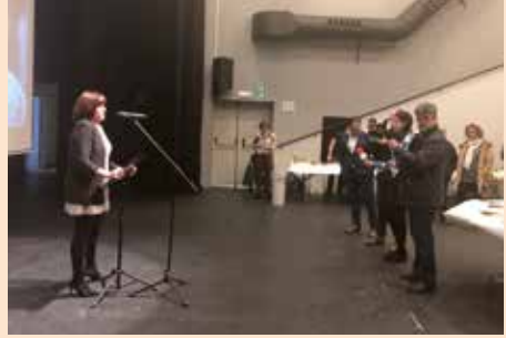
Presentación feria de la tapa