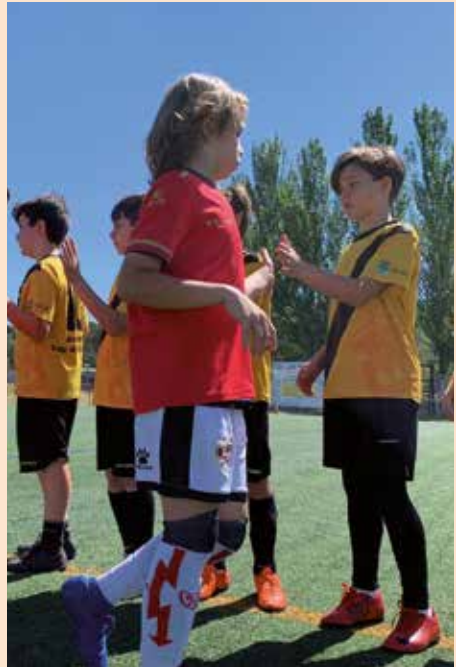
Torneo Amancio Amaro Fútbol base