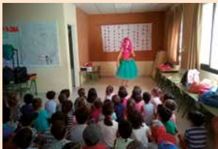
Teatro en el Miniclub