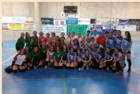
Jornada de voleibol