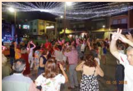
Noches de baile en la Plaza