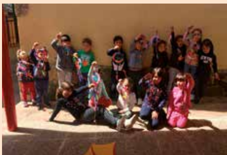
No cole semana santa 2019