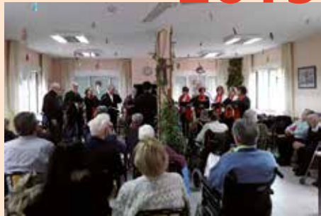
Coro de la Escuela municipal en las Residencias