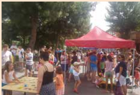
Juegos tradicionales de madera