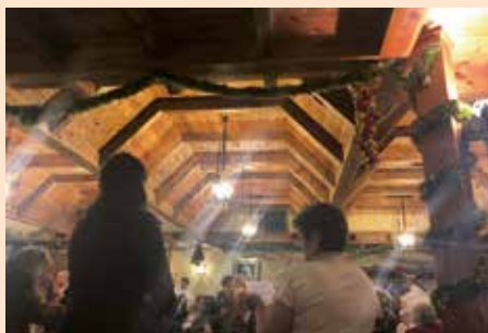
Comida navidad hogar del pensionista