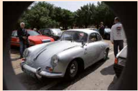
Memorial Antonio Albacete de coches antiguos