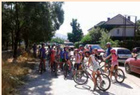
Salida en bici en el campamento de verano