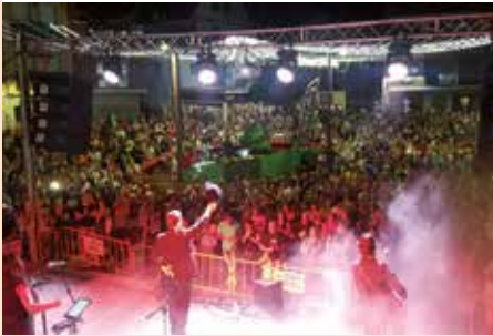
Concierto tributo a Joaquín Sabina