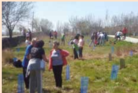
Reforestación Anillo verde