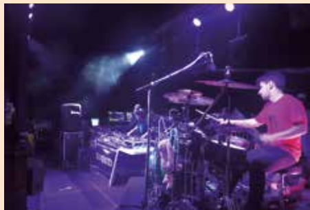
Ganadores del concurso de Djs 2018