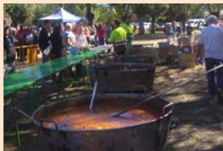
Caldereta solidaria de las Fiestas en Honor a la Virgen del Rosario