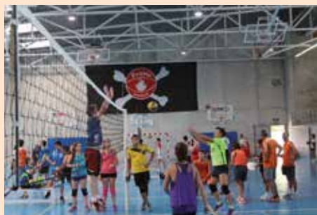
Torneo de voleibol Triple V