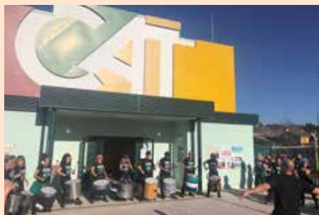
Fiesta de Carnaval 2019