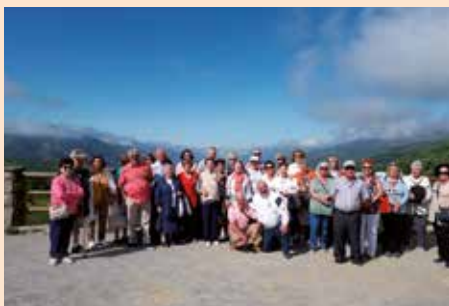
Excursión al Jerte del Hogar del Pensionista