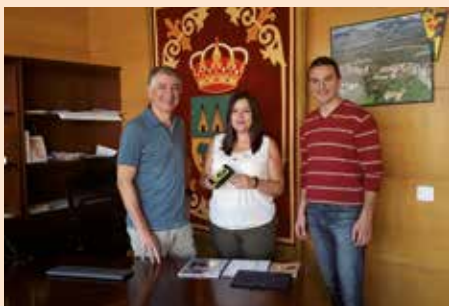
Ganadora Ciclogreen agosto