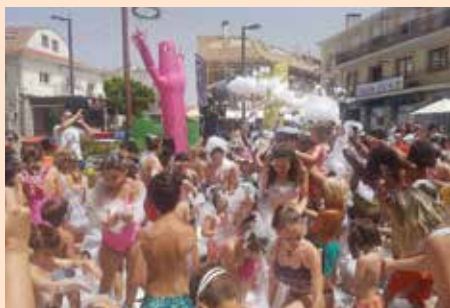
Juegos de agua en la Plaza por el Día del Niño