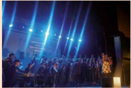
Concierto del Coro Gospel de Madrid en el CAT