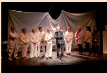
Concierto poético de Chozas de la Sierra