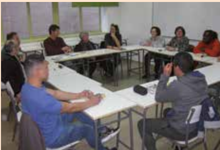
Club de lectura en el centro penitenciario