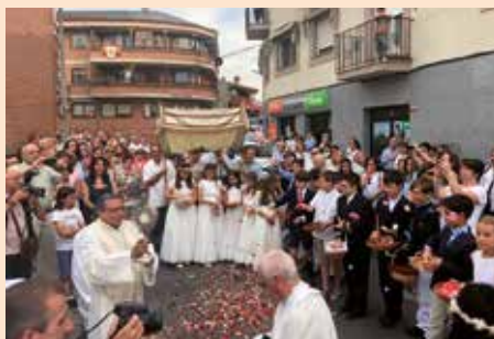
Corpus Christi Soto del Real