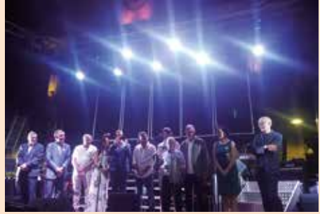
Pregoneros Fiestas Patronales 2018