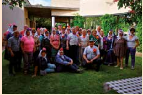
San Isidro en el Hogar del Pensionista