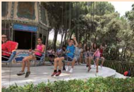
Excursión al Parque de Atracciones de Madrid