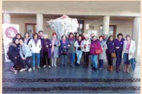
25 de Noviembre 2018