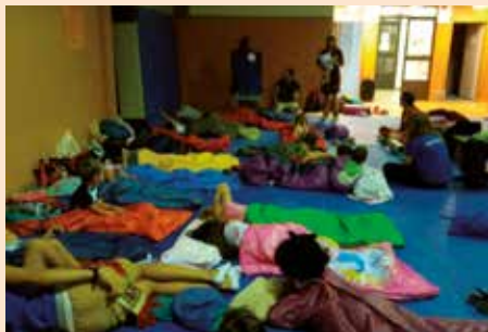
Noche en el cole