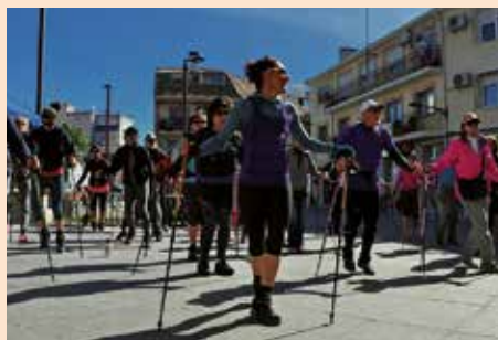
Marcha por la Igualdad del Club Nordic Walking La Maliciosa