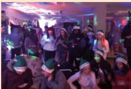
Fiestas prevas juventud