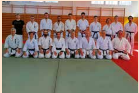
Club Koryukan Madrid