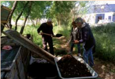
Abriendo las compostadoras con los vecinos de Sierra Real