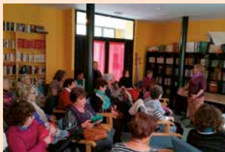
Documental La mujer cosa de hombres