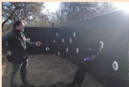
Rocco perro antidroga de Soto del Real