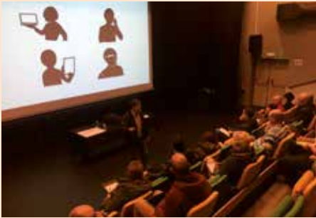
Taller de innovación Turística y empresarial