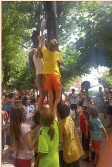
Cucaña infantil de las Fiestas