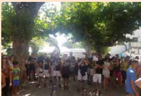
Charanga Fiestas Patronales