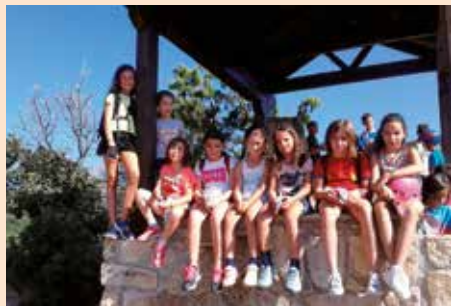
Salida a la Ermita durante el campamento