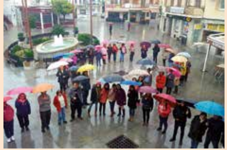
Lazo por el Día del Cáncer de Mama