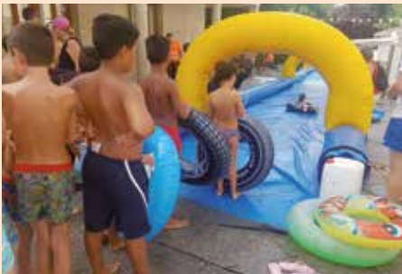
Juegos de agua en la Plaza por el Día del Niño