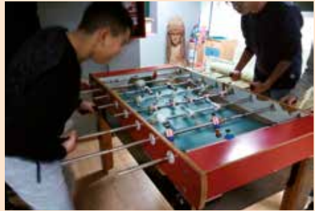
Torneo de fútbolín, Casa de la Juventud