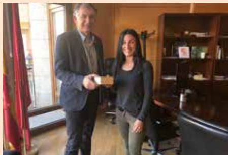
Ganadora Reto Muévete por Soto enero 2018