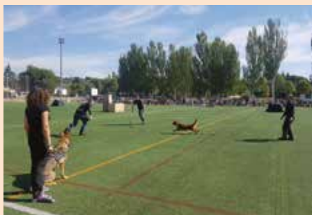
Espectáculo de la Unidad Canina de Rescate de Madrid en las Fiestas en Honor de la Virgen del Rosario