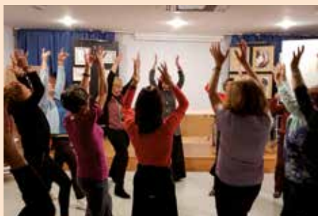
El arte de ser mujer