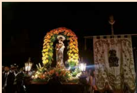
Bajada de la Virgen del Rosario en las Fiestas Patronales