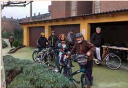
Salida taller bici social