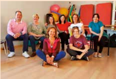
Mindfulness aplicado a la vida diaria