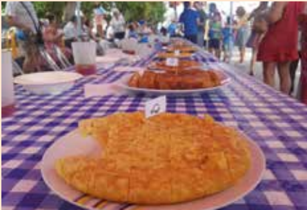
Concurso de tortillas