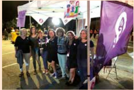
Punto Violeta de las Fiestas Patronales