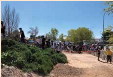
Exhibición y competición Bike Park