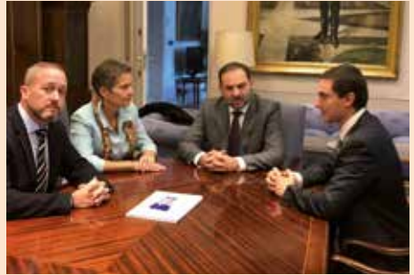
Reunión de alcaldes de la Sierra con el Ministro de Fomento sobre el tren de Cercanías