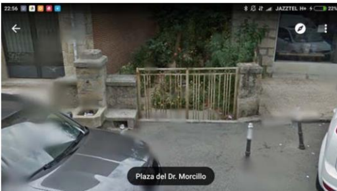
FOTO 17. PLAZA DEL DOCTOR MORCILLO 11

Corte en la acera con rampas deficientes.