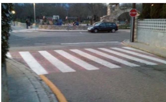
FOTO 4. IGLESIA

SOLUCIÓN: rebajar el escalón desde el portal de tal forma que se suavice o pintar en el suelo unas bandas amarillas y negras indicando el desnivel.