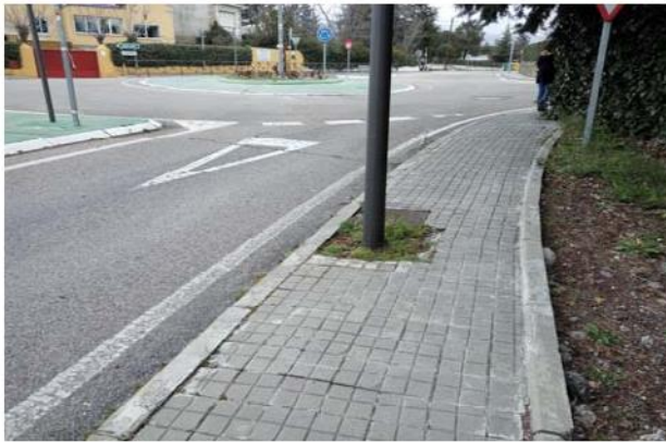
FOTO 22. Avda. VÍCTIMAS DEL TERRORISMO-M-608

Faltan las baldosas que rodean la farola y que impiden el paso de carritos de bebes.