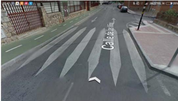
FOTO 15. CALLE VIÑAS CON CALLE ÁLAMOS

Hueco entre el paso elevado y la acera, que produce que se introduzca la rueda del carrito de bebe al pasar, además de riesgo de tropezar.