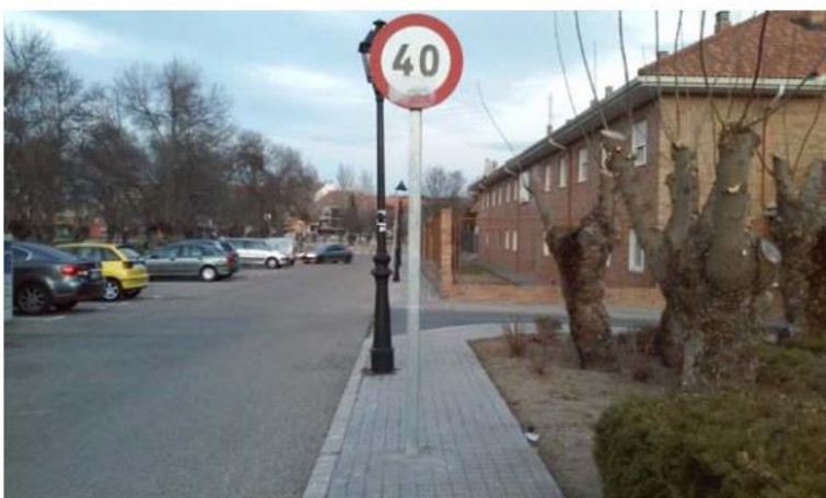
FOTO 3. AVDA. ESPAÑA. RESIDENCIA

SOLUCIÓN: desplazar el mástil hacia el bordillo y girar el cartel del nombre de la calle hacia la acera.