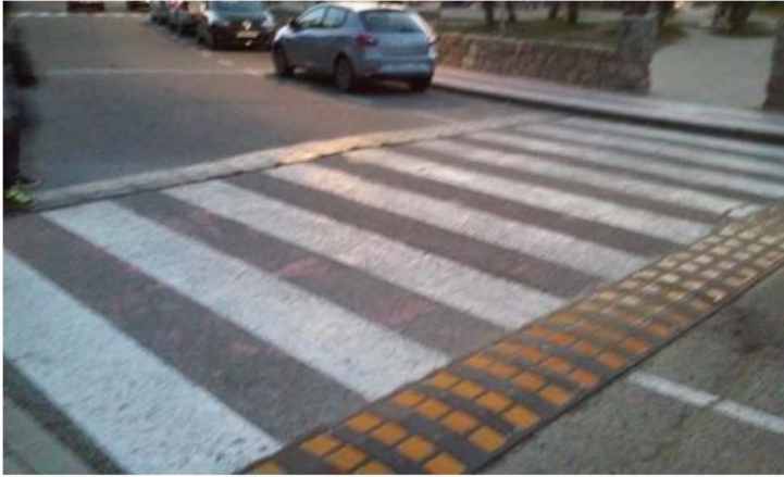
FOTO 5. PASO PEATÓN ENFRENTA PARQUE

No existe bordillo rebajado para facilitar el acceso de peatones con carrito de niños que pueden ir al parque infantil o viandantes que con carros de compra se acerquen al mercadillo a comprar.