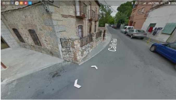
FOTO 20. CALLE REAL 31

Finalización en falso de la acera, con imposibilidad de paso de carros.