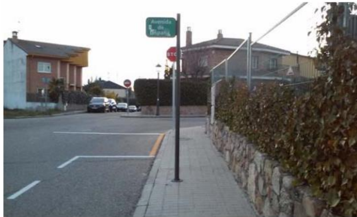
FOTO 2. AVDA. ESPAÑA

SOLUCIÓN: desplazarlas hacia el bordillo