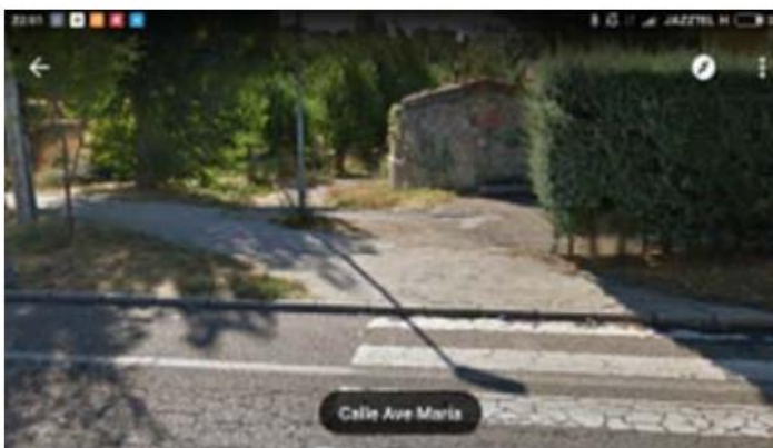
FOTO 16. CARRETERA DE EL ESCORIAL A TORRELAGUNA ESQUINA CALLE AVE MARIA

SOLUCIÓN: reducir con cemento ese espacio.