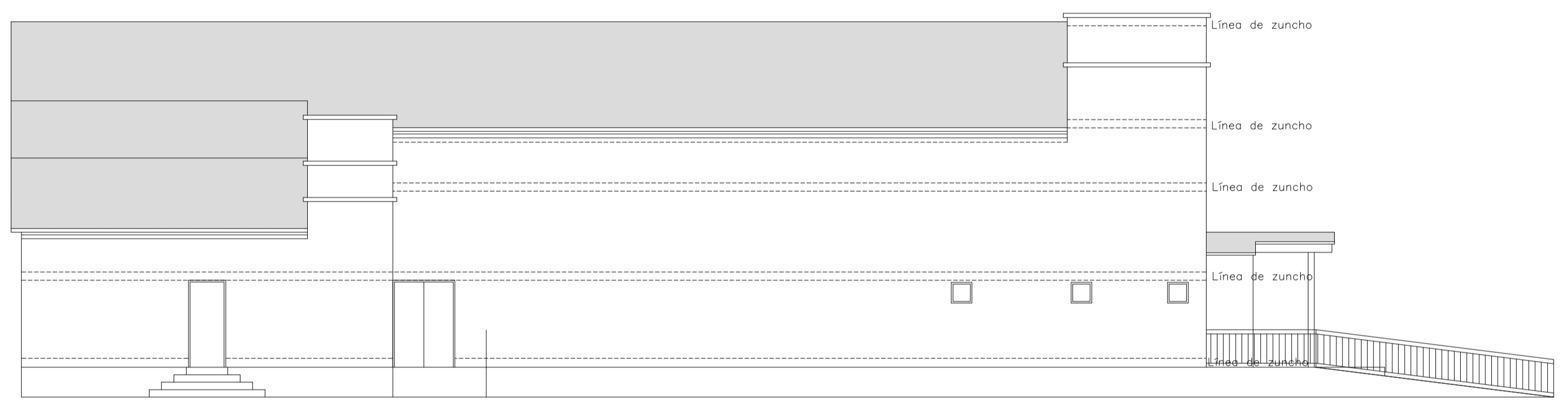
ALZADO LATERAL IZQUIERDO